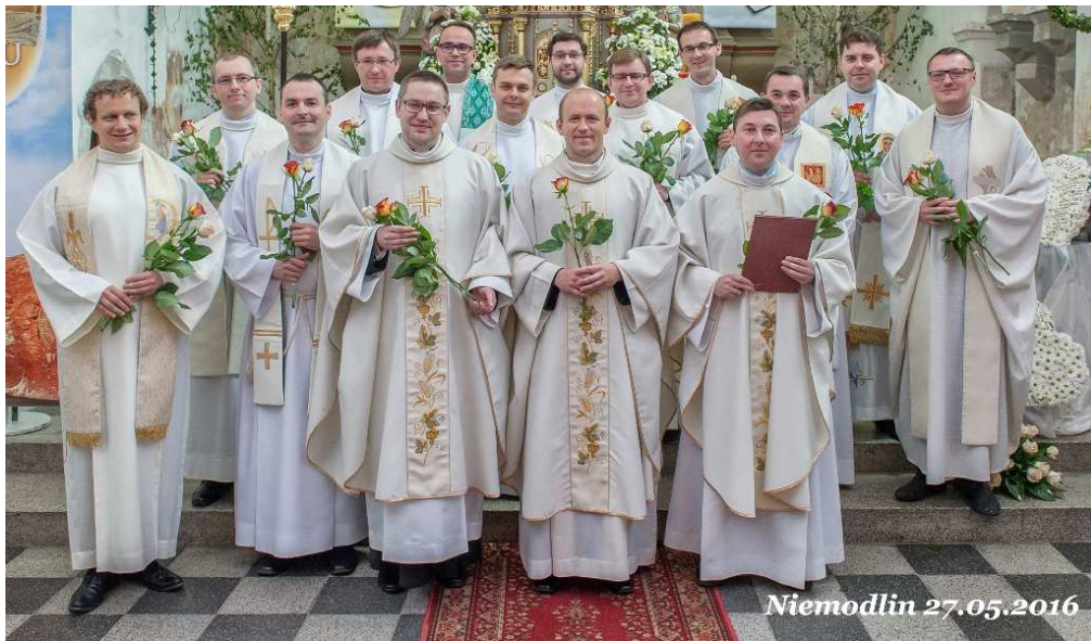
„Zjazd kursowy” księży diecezji opolskiej i gliwickiej w Niemodlinie